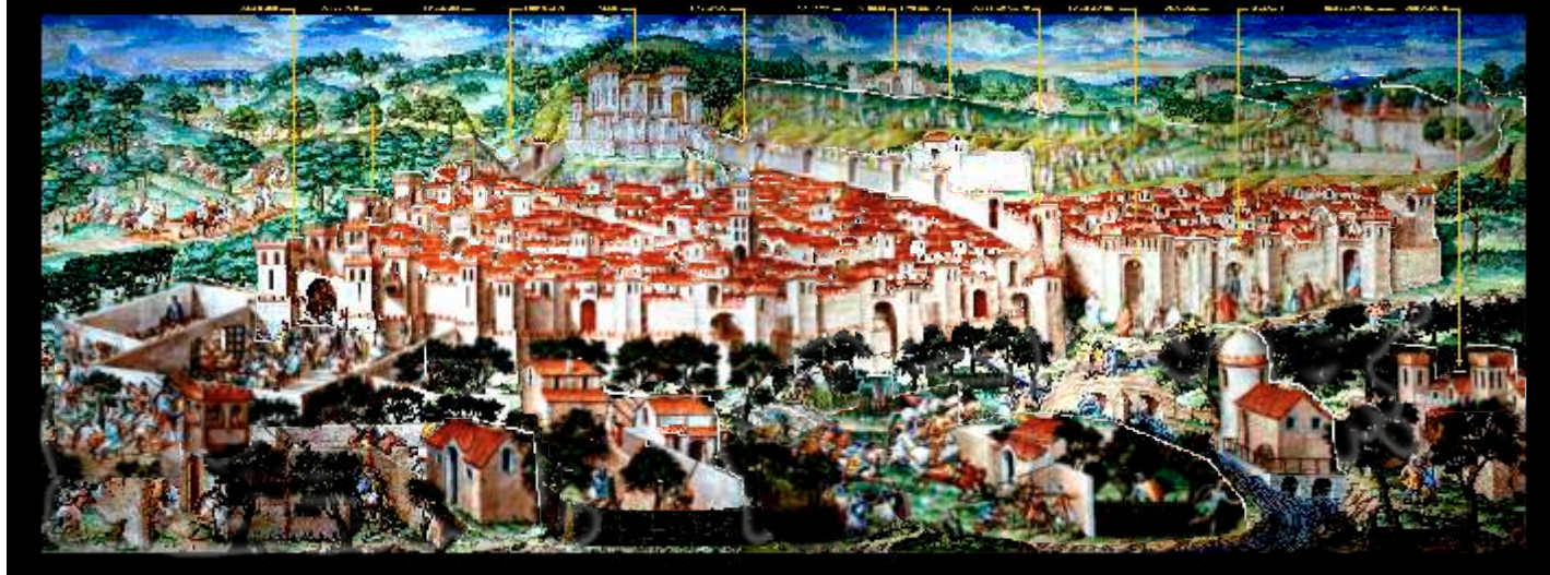
Granada en la Batalla de la Higueruela; 1431